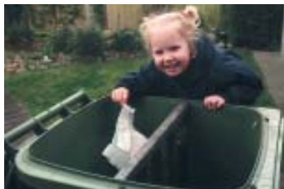
Zet uw bak zo vol mogelijk aan de straat.

Met al deze tips en de Afvalwijzer die u in januari hebt ontvangen, kunt u zoveel mogelijk profiteren van het nieuwe afvalinzamelsysteem. Want u bepaalt wat u betaalt!